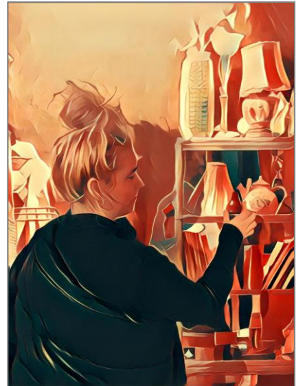
Eksempel på elevarbeid, DKS 2017