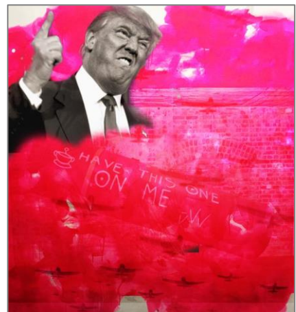
Eksempel på elevarbeid, DKS 2017